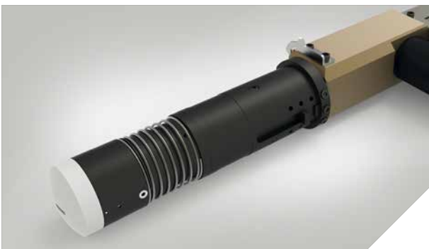
EOT – Lame oscillante jusqu'à 15 000 rotations/min