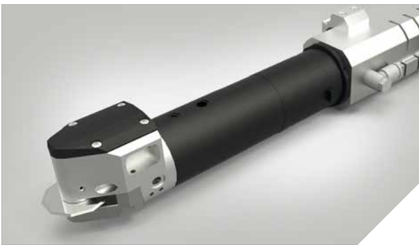
PRT – Lame rotative entraînée jusqu'à 11 000 rotations/min