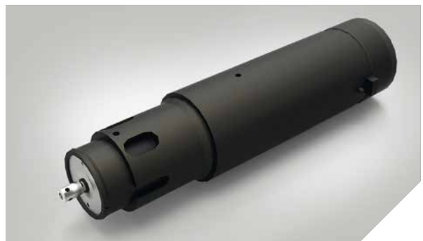
KCT – Outil Kiss-Cut (demi-chair) coupe dans la matière mais pas dans le matériau de support