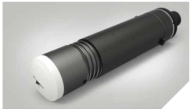
UCT – Couteau droit contrôle tangentielle